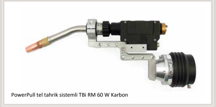
PowerPull tel tahrik sistemli TBi RM 60 W Karbon