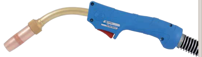
TBI 7 W Carbon